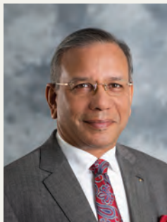
К. Р. РАВИНДРАН, ПРЕЗИДЕНТ, РОТАРИ ИНТЕРНЕСЪНЪЛ