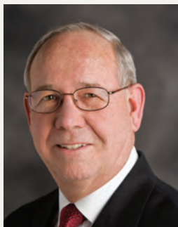
Рей Клингсмит, ПРЕДСЕДАТЕЛ НА СЪВЕТА НА ПОПЕЧИТЕЛИТЕ НА ФОНДАЦИЯ РОТАРИ